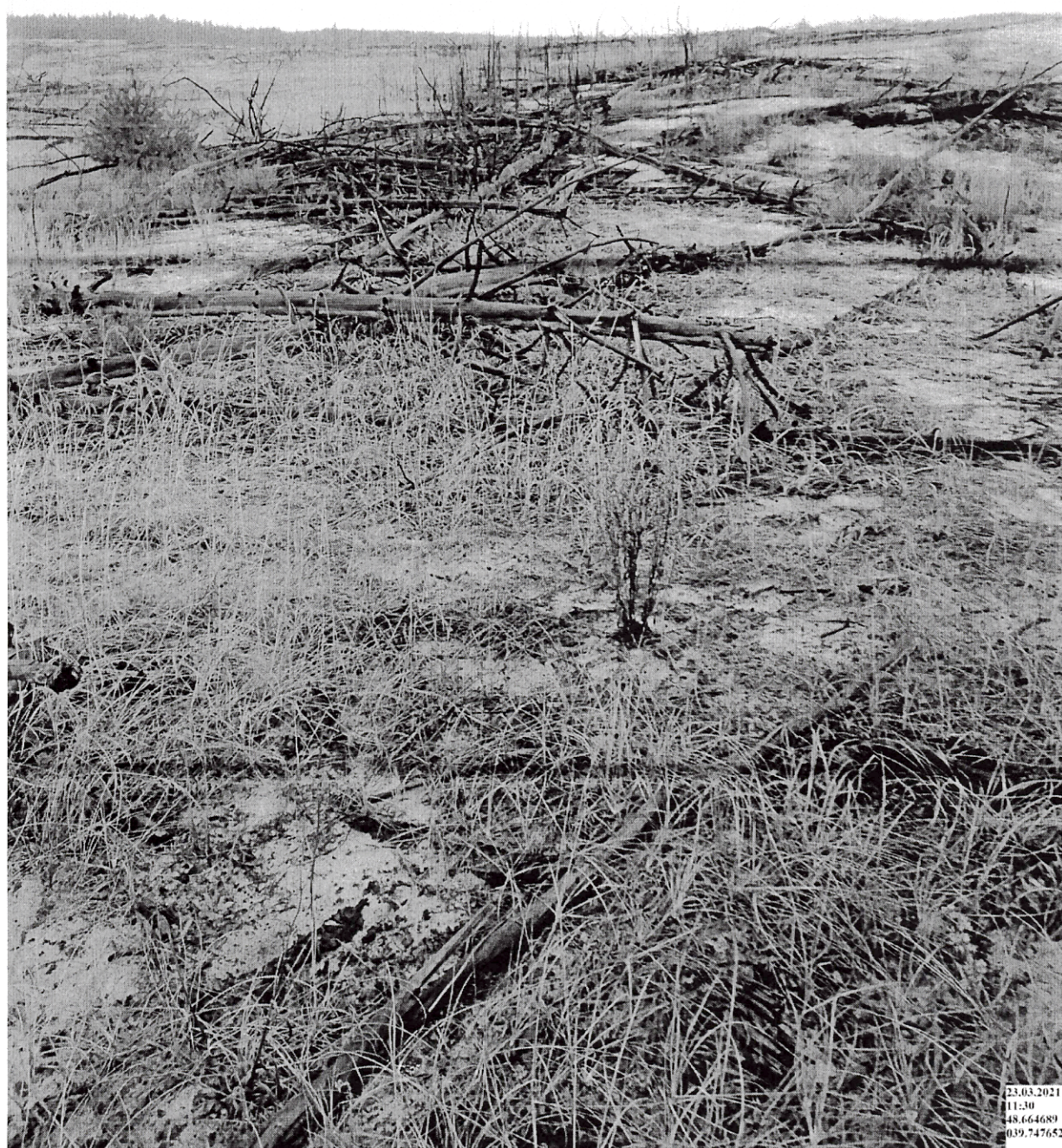
Общий вид насаждения поврежденного верховой пожаром 2008 года в квартале 17 выделе 9 Тарасовского лесничества Митякинского участкового лесничества