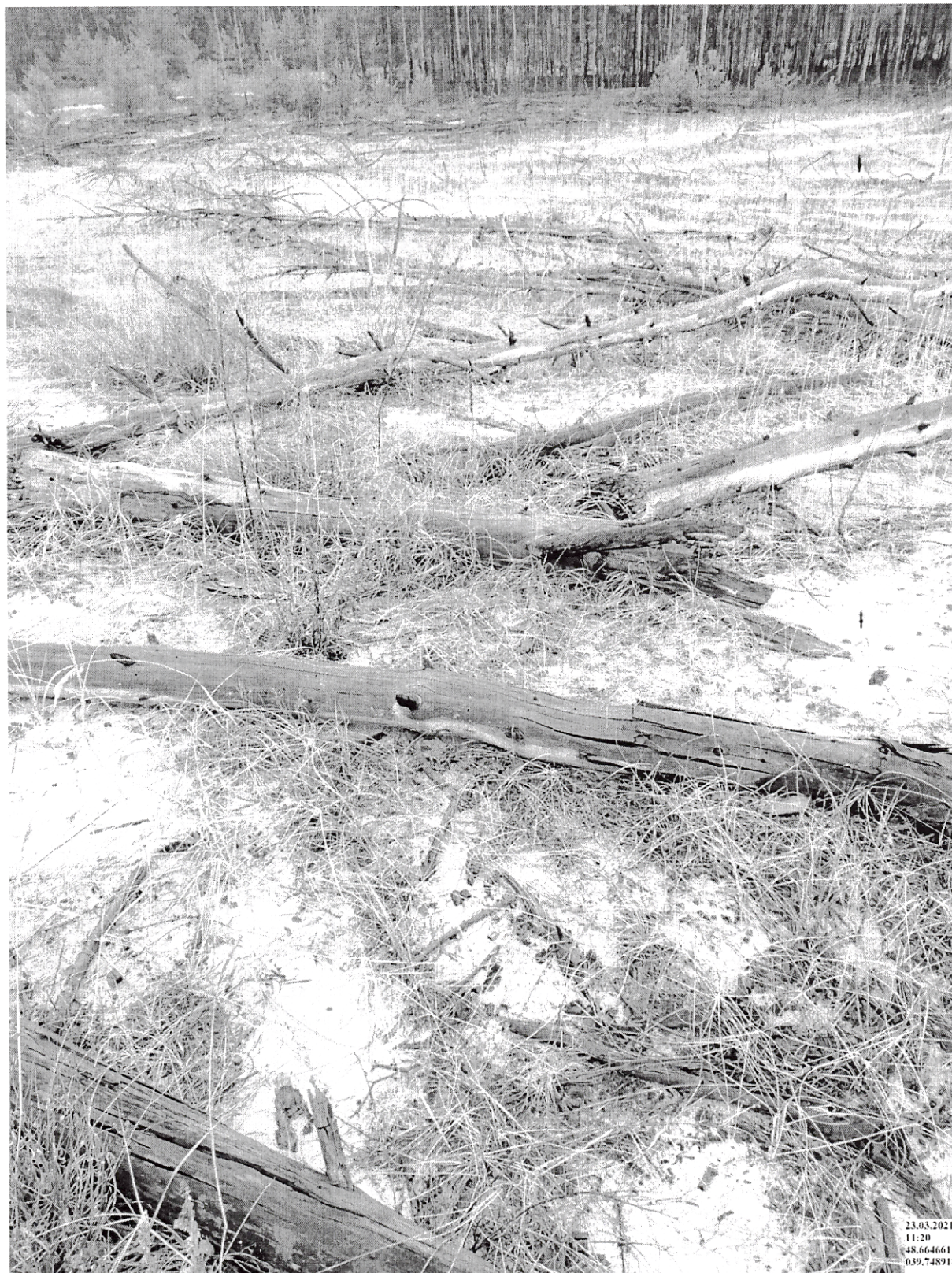
Общий вид насаждения поврежденного верховой пожаром 2008 года в квартале 17 выделе 9 Тарасовского лесничества Митякинского участкового лесничества